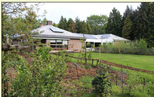
Speelveld met afgesloten vijver